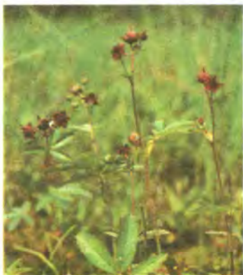
423. Росичка круглолиста.